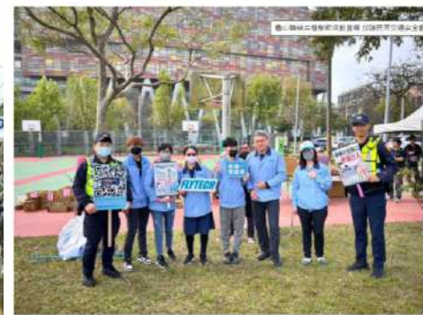
今年至今龜山地區A1交通事故已減少4件、A2交通事故減少127件、行人交通事故減少9件。

為維護行人及用路人安全，桃園市龜山警分局於今(11)日利用華亞科技園區舉辦「植樹節活動」，辦理交通安全宣導活動，主題以防制酒後駕車及駕駛車輛等讓行人為主，以有效的制酒後駕車等行為，此次活動參加人員以科技人員為主，主要呼籲勿酒後駕車及提升駕駛人駕駛車輛等讓行人觀念，結合員警宣導講解，以達到宣導效果。